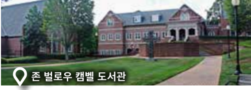
존 벨로우 캠퍼스 도서관