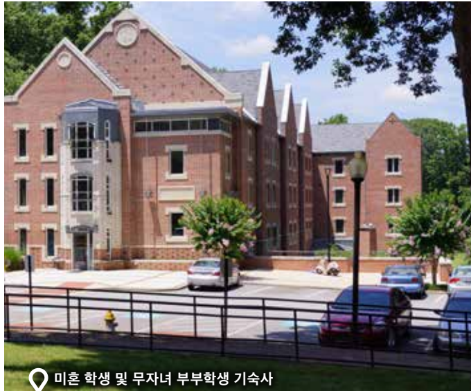
미혼 학생 및 무자녀 부부학생 기숙사