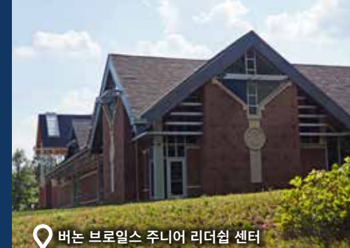
버논 브로일스 주니어 리더십 센터