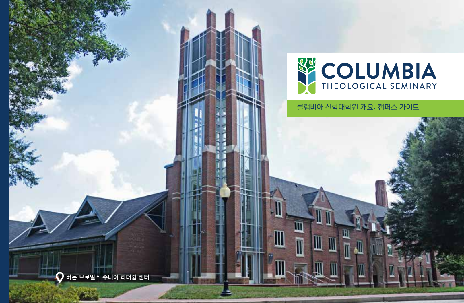
버논 S. 브로일스 주니어 리더십 센터

기숙사와 빌리지 사이에 위치한 곳으로 학생들과 공동체가 예배와 운동, 놀이와 쉼을 갖는 곳이다. 운동장 한편에 위치한 가든에서는 농작물을 재배할 수 있다.