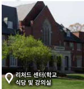
리처드 센터(학교 식당 및 강의실)