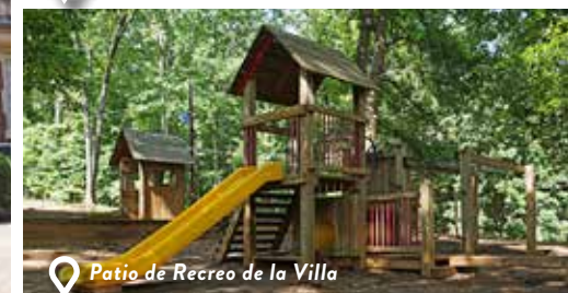
Patio de Recreo de la Villa