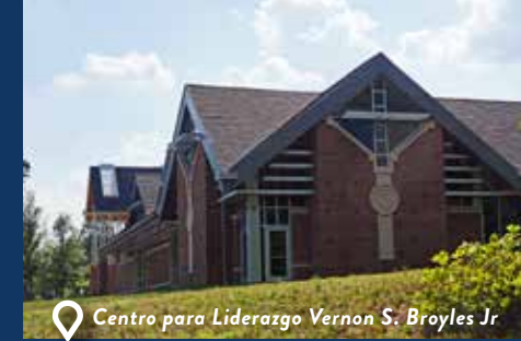
Centro para Liderazgo Vernon S. Broyles Jr.

Asuntos Académicos 1 Administración 1 Admisiones 1 Estudios Avanzados 4 Asuntos de Graduados 1 Archivos y Colección Montreat 2 Auditorio 4 Librería 10 Oficina de Negocios 1 Oficina de Beneficios y Pensiones 4 Servicios Centrales (correo, copiadoras, fax) 1 Capilla en Campbell Hall 1 Capilla del Centro Harrington 4 Salones (1, 8, 10) Comunicaciones 1 Cocina Comunitaria 6 Laboratorio de Computación 2, 4 Servicios de Redes Computacionales 1 Educación Contextual 1 Servicios Alimenticios y Cafetería 8 Patio 10 Servicios de Desarrollo 1 Salón Dobbs 8