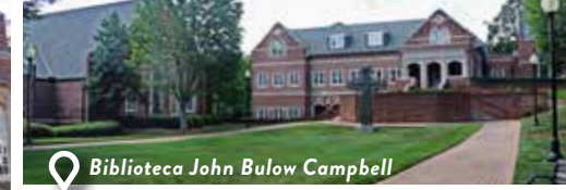
Biblioteca John Bulow Campbell

Ésta es la residencia en el campus del presidente del seminario y su familia. La casa del presidente también sirve con frecuencia como un lugar de hospitalidad y calor de hogar para eventos del seminario, reuniones informales y comidas.