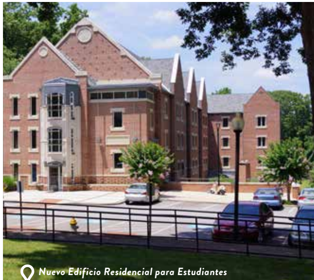
Nuevo Edificio Residencial para Estudiantes