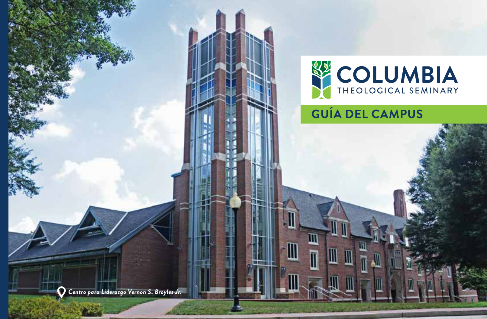
Centro para Liderazgo Vernon S. Broyles Jr.

Estas áreas son exclusivas para estudiantes y miembros de la comunidad para orar, jugar, sembrar y descansar.